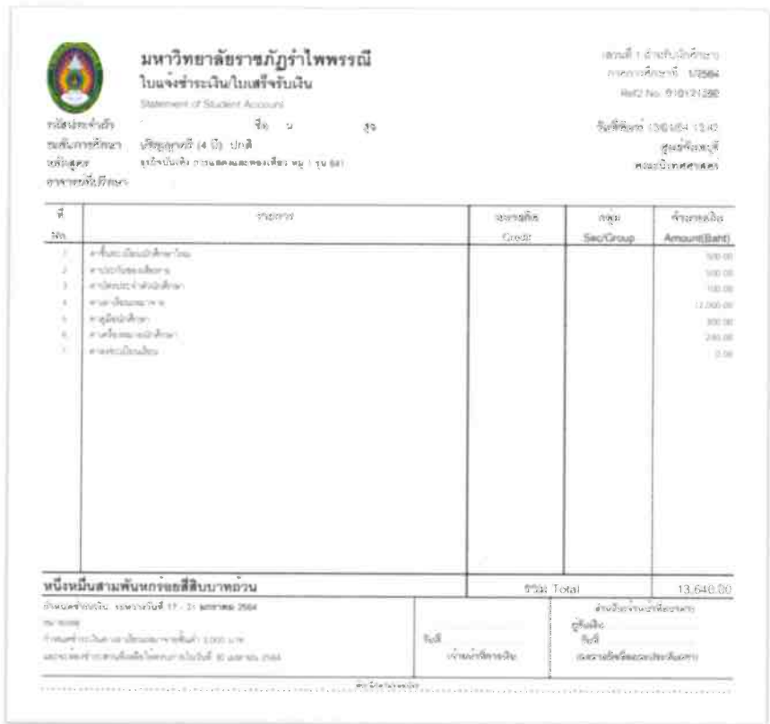
รูปแสดงกรณีที่นักศึกษายังไม่ชำระค่ารายงานตัว